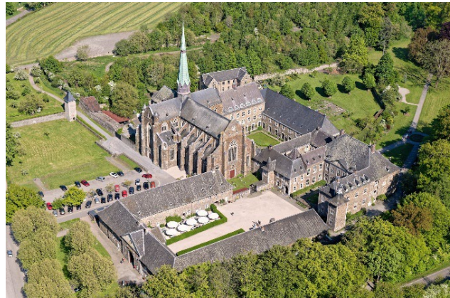
(Abbaye du Val Dieu et Moulin du Val Dieu)

L'après-midi sera consacrée à découvrir une série des plus beaux villages de Wallonie : Clermont sur-Berwinne, Olne, Soiron, quelques perles de cette région bocagère.