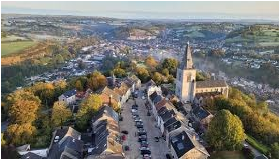
(Limbourg, un éperon au-dessus de la vallée de la Vesdre)