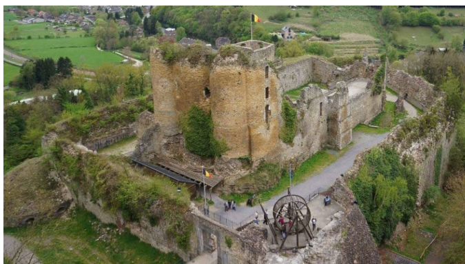
(Theux et le château des 600 Franchimontois, histoire clic ici )

Fin de journée du samedi, nous déposerons nos bagages au R-Hôtel à Remouchamps (clic ici ) qui répond aux meilleurs critères hôteliers pour nous accueillir chaleureusement pour un repas et une nuit réparatrice. Cet hôtel, pour les fans de cyclisme, est situé à côté de la côte de la Redoute, côte célèbre de la course Liège-Bastogne-Liège. Pour les amateurs, il sera possible d'accéder au wellness et au fitness.