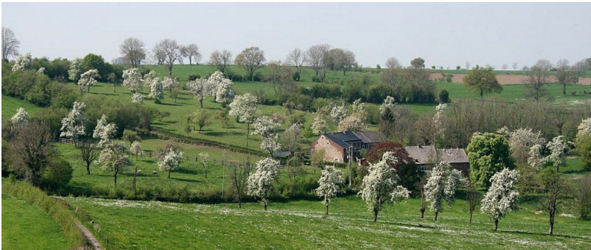
(Bocage: prairies et arbres fruitiers)

Le Moulin de Val Dieu ( clic ici ), située en face de l'Abbaye du même nom, nous accueillera pour la pause de midi où les amateurs de bière pourront déguster la bière produite dans l'Abbaye ( clic ici ). Il sera possible pour ceux et celles qui le souhaitent de faire un détour par le magasin de l'Abbaye où des produits locaux pourront être achetés.